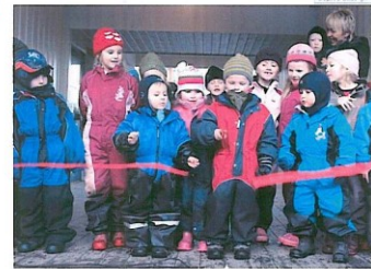
STOLT: Barna åpnet selv kunstutstillingen med sang og snorokjøping. Etterpå stamlet små og store inn for å se utstillingen.