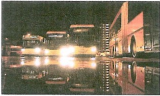
KOLLEKTIV PULS: Busskjøfjre er blant de første på jobb i byen. Møt flere som er opp om natten i bildefortellingene på bt.no.